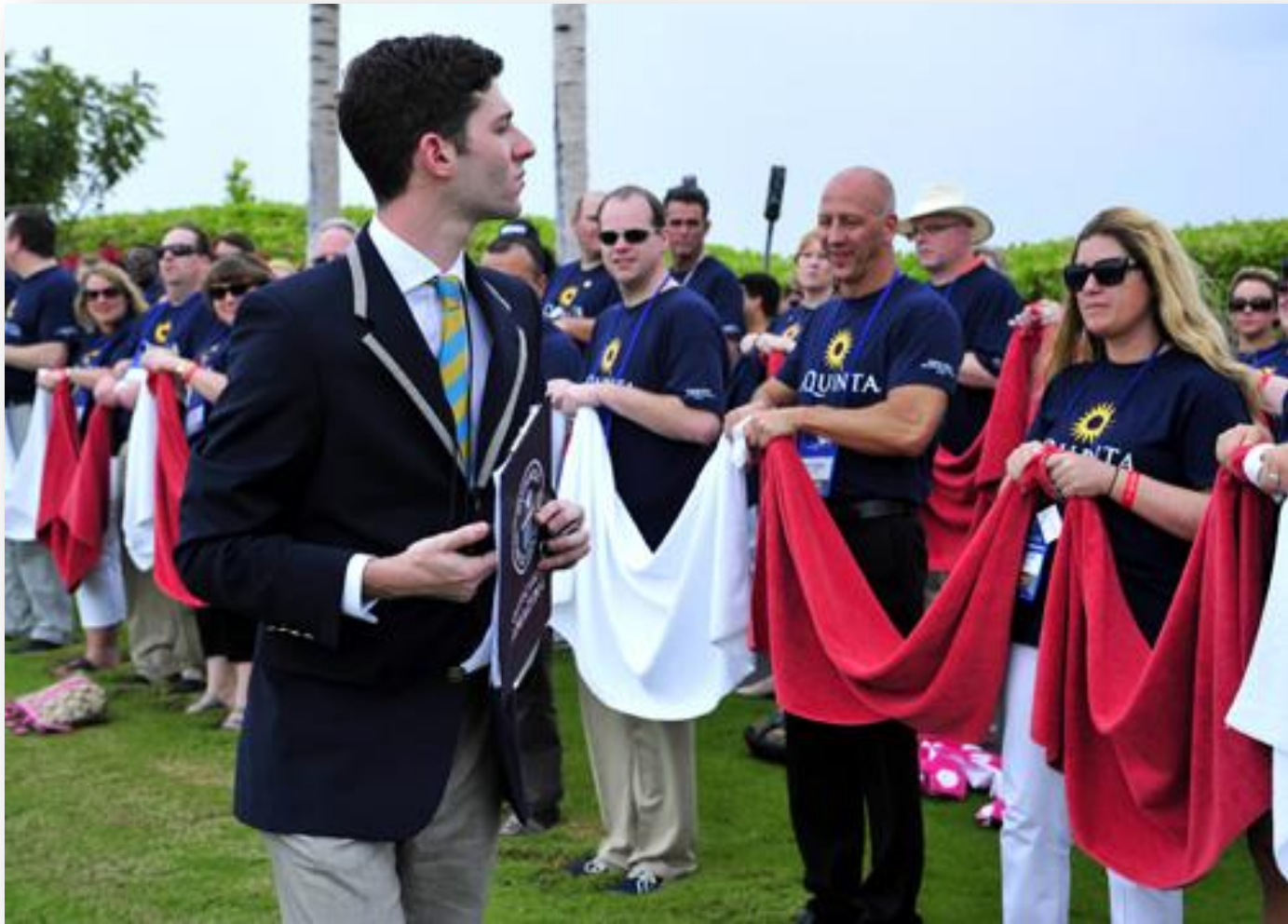
“La Quinta Inn & Suites” Waikoloa, Hawaii – 2014 1113 partecipanti